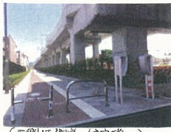
(西側は側道、住宅地)

8月31日市会まちづくり委員会で、阪急洛西口～桂駅間プロジェクト整備計画の概要報告されました。これは2017年12月21日京都が阪急電鉄と連携協定を結んだことから開始しています。 日本共産党の委員は、高架の西側の住民が静かに穏やかに暮らしたいと願われていること、5月31日開催の地元説明会では、阪急側の16室30人くらい泊まれる宿泊施設という提案に住民から不安や不要との声が出された事実を示し、地域の思いに反するようなものを作るべきでないと言いました。今回の提案では、宿泊施設という表現は変えています。観光にも資する宿泊機能をもつものの検討は必要と阪急側に意向があることが当局の答弁で明らかになりました。京都市の活用スペース(金銭)は、利用しやすい公共施設に等しい。地域住民の意向を尊重するよう強く求めました。