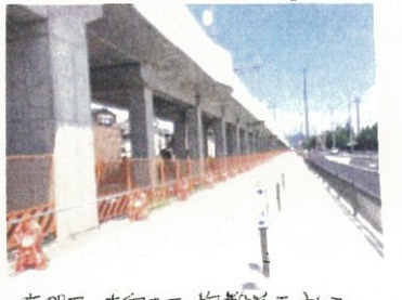
高架下・南向き施設等を計画

おしらせ 9月21日(木)から9月市会です。議事に陳情・請願を提出される方は、9月26日(火)午後5時まで市会事務局にご提出下さい。