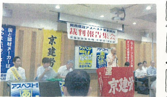
7月3日、関西建設アスベスト京都訴訟裁判の傍聴に行きました。