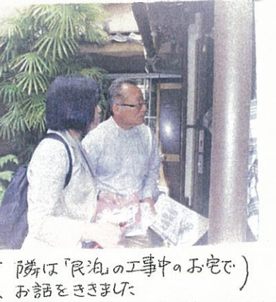
(隣は「民泊」の工事中のお宅で) お話をききました

いる民泊でも住民への説明が十分されていない所、騒音のトラブルなどが起こっています。路地の中 が一軒を除去民泊となっていて、以前から営業している旅館の経営不振のお話も聞きました。この日の調査の実態は、19日の代表質問でも示し、市の指導強化を求めました。