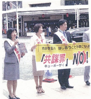
(5/16 30分で38筆「共謀罪」法案反対の署名が集まりました)

憲法が保障している内心の自由を侵害する「共謀罪」法案。説明が不十分だ」という批判や「一般市民も対象とされる」とへの不安などが渦巻く中、23日に衆議院本会議で採決が強行され、自民・公明、維新などの賛成多数で可決されました。許せません。国連からの批判、懸念の声にも向き合えない安倍政権。憲法を尊重し擁護する義務を負っているという(憲法第99条)自覚もあり