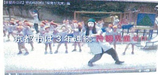
京都市情報館のトップに ある「平成KIZOKU」の「平 成KIZOKU」の「保育が充実」編を見た 市民から「実態とちがう」 「市民の気持ちがあわていない」 と、批判の声があがっています！