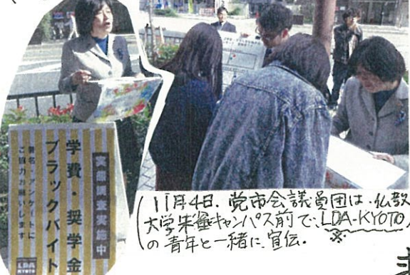
11月4日、党市会議員団は、仏教 大学朱雀キャンパス前でLDA-KYOTO の青年と一緒に宣伝。