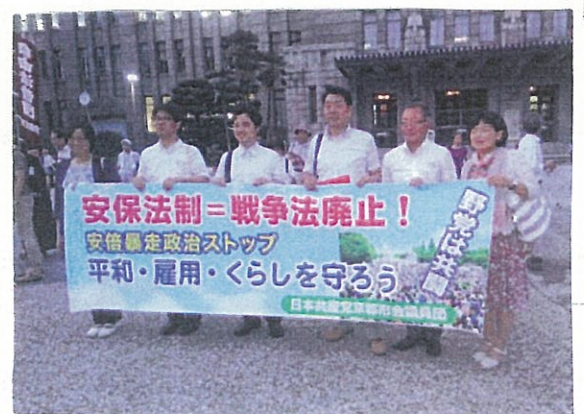
8月19日「戦争法廃止! 京都デモ、集会」に500人の人々が参加。私も市議団の人たちと参加しました。

安保法制(戦争法)No. 自衛隊員の命を守る! 政府は、昨年9月に強行成立させた安保法制(戦争法)に基づく自衛隊の新任務の訓練を全面的に着手しようとしています。治安情勢が悪化しているアフリカ・南スーダンの国連平和維持活動(PKO)に11月から派兵予定の陸上自衛隊へ新たな任務を加えようとされています。駆けつけ警護で武器使用も可能とするものです。殺し殺される危険が高まります。絶対に止めなければなりません。