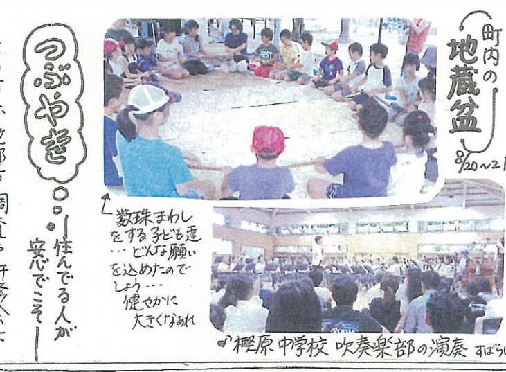
町内の「地藏盆」8/20~21 数珠まわしをする子ども達…どんな願いを込めたのか、しゅりゃく…健康に大きくなあれ 梶原中学校吹奏楽部の演奏 不ばいん

つづやき この夏、他都市調査や研修会に数回行ってきました。少子高齢化、人口減少、その中で「地方創生」…こんなテーマが語られます。コンパクトシティだと、周辺部を切り捨て、都市部に集中しようという流れです。一方で、訪れる人や住む人もどう増やすか…と、洛西ニュータウンも「アクリションプログラム」をつくり、まちの活性化を、検討が進められています。10年前に住民の声を生かして作られた「洛西ニュータウンまちづくりビジョン」がどう実現してきたのか、地下鉄は、つづやき、人々の声、交通問題やサセスターの活性化抜きには、語れません。今、住んでいる人の声が大勢、住民が安心して暮らす…です。