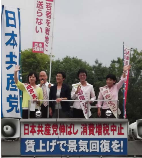
(9月6日エミナス前、倉林参院議員を越え、宣伝)

9月15日、日本中の原発が 停止して丸一年の日。四条河 原町付近を3隊の市民パレード デモが通りました。私は「ほ んまもん日本一の保育・学童 保育がいいな」アピールパレ ードと「戦争あかん」市民デモに 参加しました。(2つのデモの間に原 発いらないこともデモ行われました)