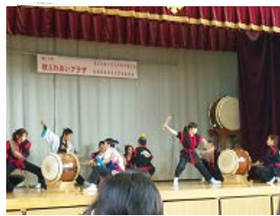
11/8 桂川小学校 フォーク