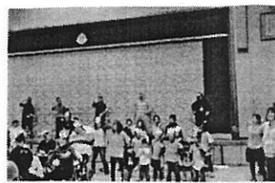
11/9 カワラ川ふれあいまつり