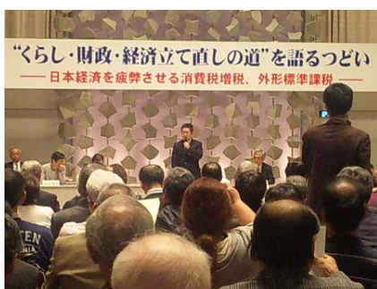
(11月8日「ついで」で語り小池見 谷院議員)

消費増税をやめさせよう! 日本共産党の地域アンケートには、消費税が8%になってくらしが厳しい、先行き不安だという声が多数寄せられています。地元のスパリの店主は、「大型店出店対策の値下げ競争に消費税は、小売店が続けていけない」と暗い顔でした。駅頭宣伝で「消費増税をやめさせよう」と訴えると「そうだ」と共感してくれた高校生。安倍内閣がすすめている消費増税路線は、国民のくらしの実態や願いとかけ離れています。消費が低迷している実態の中、「増税先送り」といわれていますが、消費税そのものが負担と格差を大きくするものです。大企業法人税減税、社会保障切捨てへの怒りも広がっています。政府は増税を中止せよ!