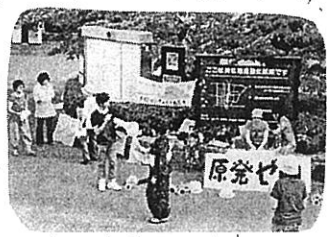
7/23 西京原発ゼロネットライブ宣伝

集団的自衛権の行使容認の閣議決定、川内原発の再稼働、医療・介護の改悪... 地域を回ると、怒りの声がいっぱい。です。原発ゼロネットの宣伝には、通りかかった青年が飛び入りでマイクを握って、思いを語り訴えました。国民の声と運動を広げ、戦争する国づくりを許さない! 原発なくそう! 福祉、くらし守れ! の世論で、安倍政権を追いつめよう。