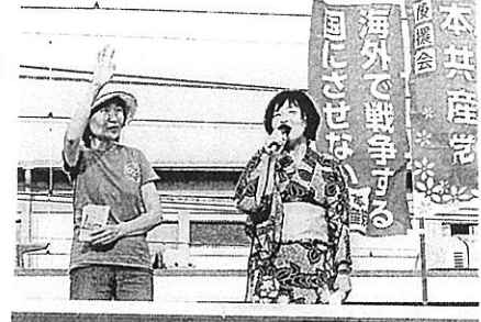
7/16 嵯峨山駅西口 女性後援会と嵯峨山宣伝